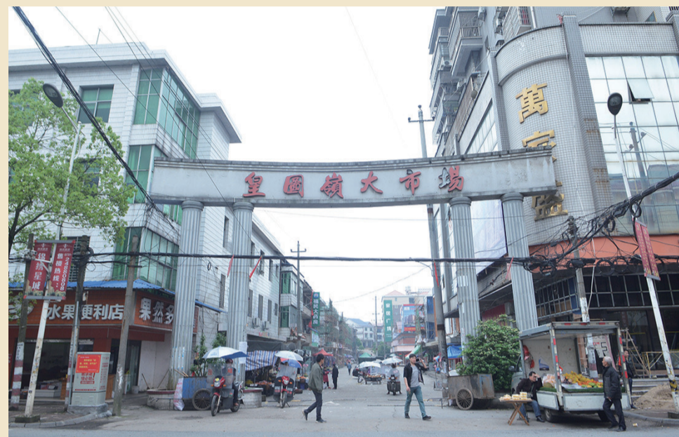
▲攸县皇图岭