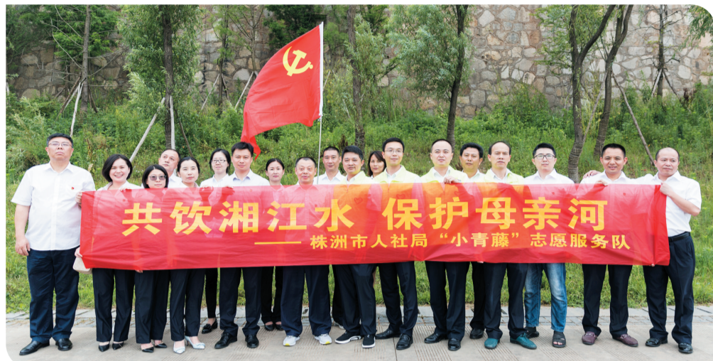
保护母亲河志愿服务活动

以惩防体系建设为总揽，以规范考务考试、职称评审、劳动监察执法、资金使用为重点，完善“双随机一公开”“一事双岗双审”“基金收支两条线”防控措施，锁紧关键环节，堵住关键漏洞。紧盯基金、资金安全这个重中之重，建立我查我、我查他、他查我“三查”长效监管机制，健全“上下联动、靶向培训、交叉找茬”运行体系，累计开展“三查”行动30多次，均未发现或反馈重大问题。