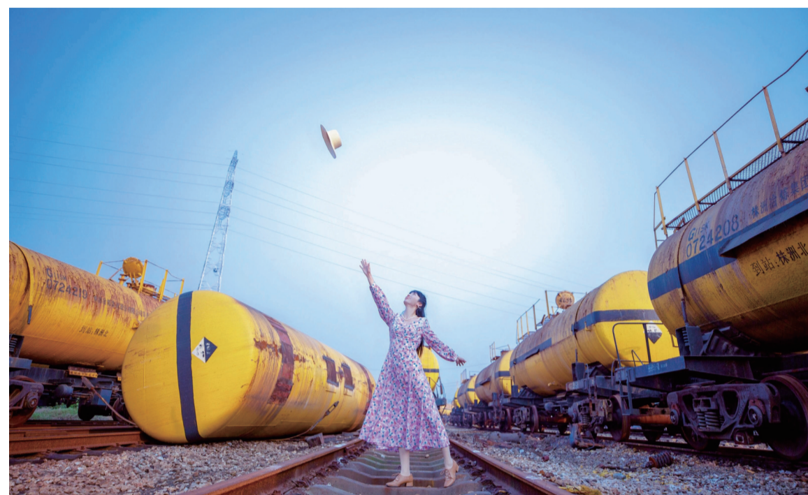
▲上周一傍晚,石峰区喻家坪调车站,斑驳的罐车和铁轨在夕阳的映衬下格外安静