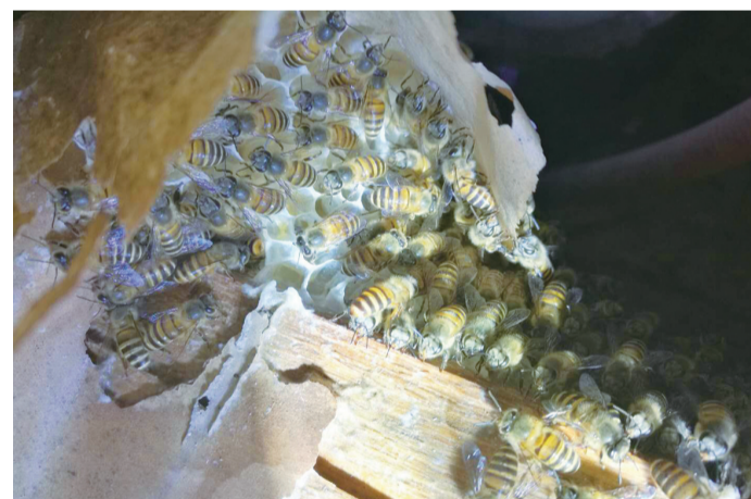
▲蜜蜂在钟先生家阳台上的柜子里筑巢