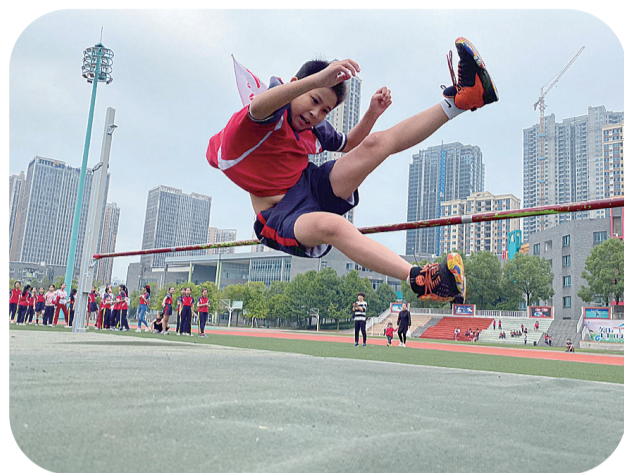
▲跳高项目