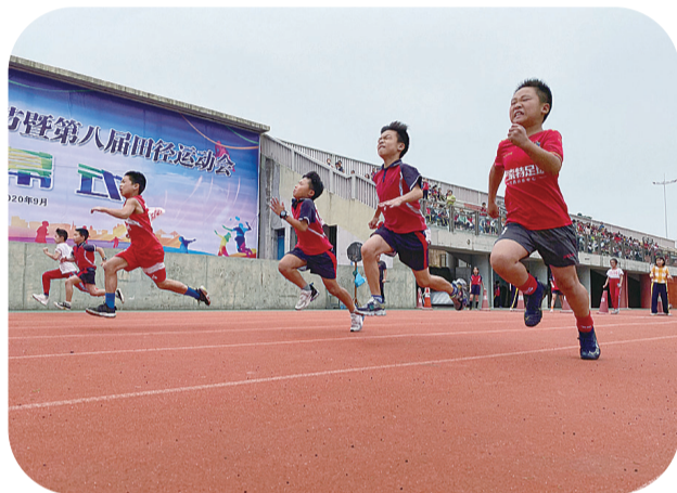
▲田径赛跑项目