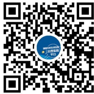
微信扫一扫,使用小程序

“接到投诉后,县级单位将对举报信息进行核实,并及时整改。随后,他们将把整改结果反馈给用户,由其进行评价。未达到要求的,要重新整治。对于一些疑难问题,将由市一级进行督办。”市城管局相关负责人介绍。