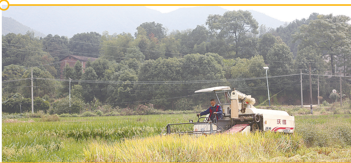
图为收割机正在收割水稻。