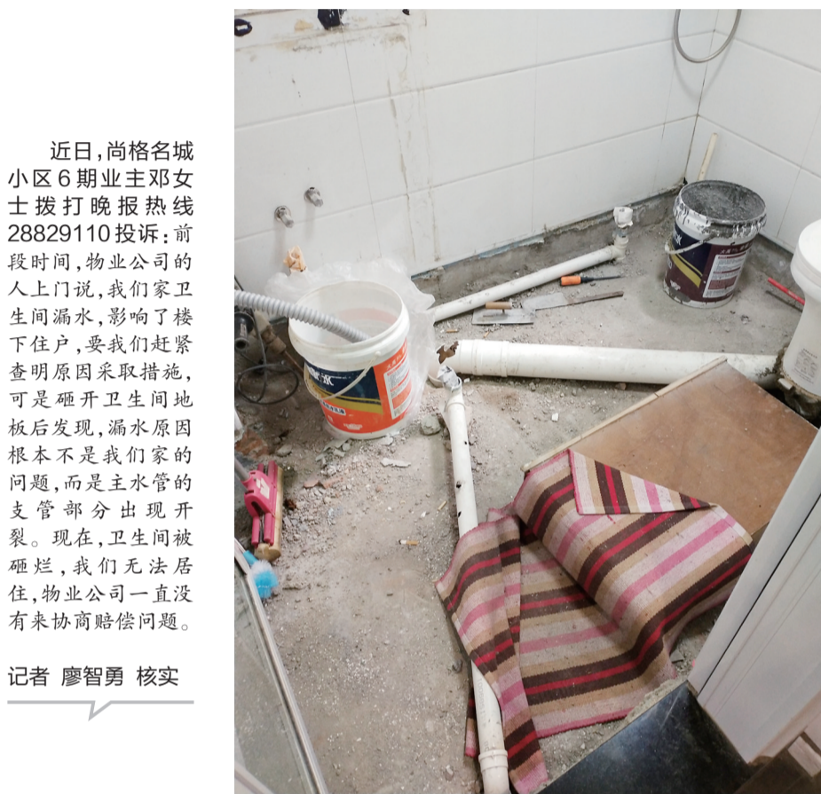
▲邓女士家被砸开的卫生间

近日,尚格名城小区6期业主邓女士拨打晚报热线28829110投诉:前段时间,物业公司的人上门说,我们家卫生间漏水,影响了楼下住户,要我们赶紧查明原因采取措施,可是砸开卫生间地板后发现,漏水原因根本不是我们家的,而是主水管的支管部分出现开裂。现在,卫生间被砸烂,我们无法居住,物业公司一直没有来协商赔偿问题。