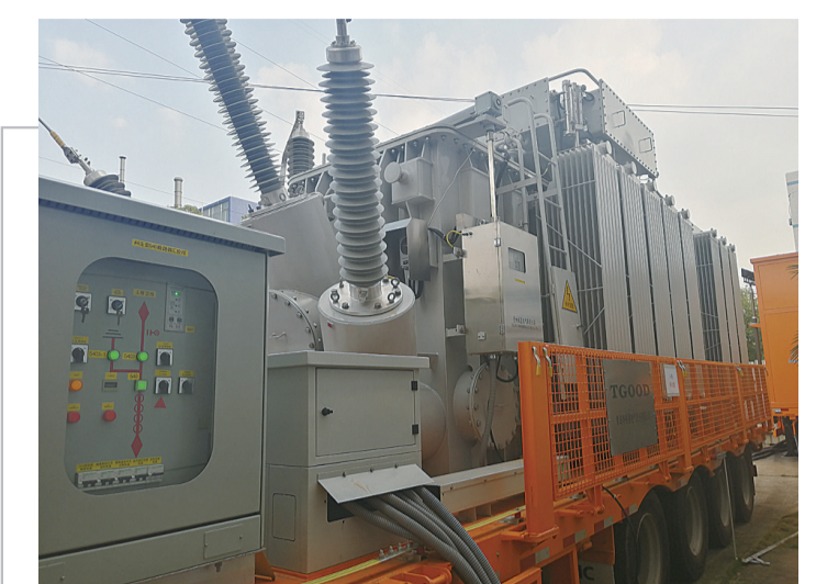
▲株洲电网首台车载移动变电站投入运营