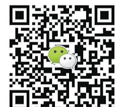
扫一扫二维码,添加微信