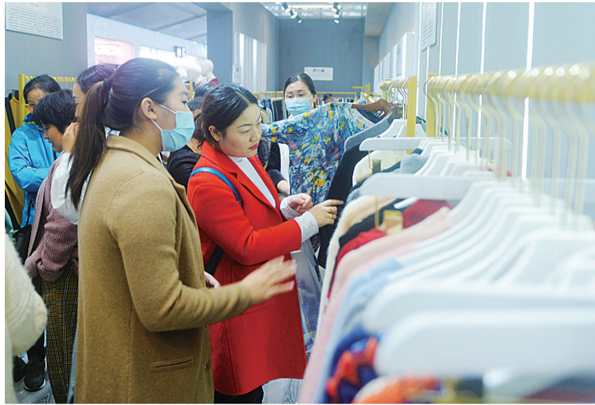
▲市民在芦淞服饰市场选购服装