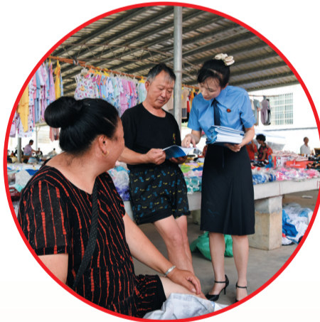
▲检察官走进集市为群众送上法治“食粮”。

这些年,市院在办案中坚持“少捕慎诉、教育为主、惩罚为辅”原则,同时指导天元区人民检察院与湖南工业大学等11家单位或机构合作,建立了未成年人观护教育基地,组织涉案未成年人前往参观、接受培训,携手司法社工和心理疏导机构等社会力量,针对涉案未成年人开展心理辅导和法治教育1000余人次,帮助近400余名涉案未成年人顺利回归社会。