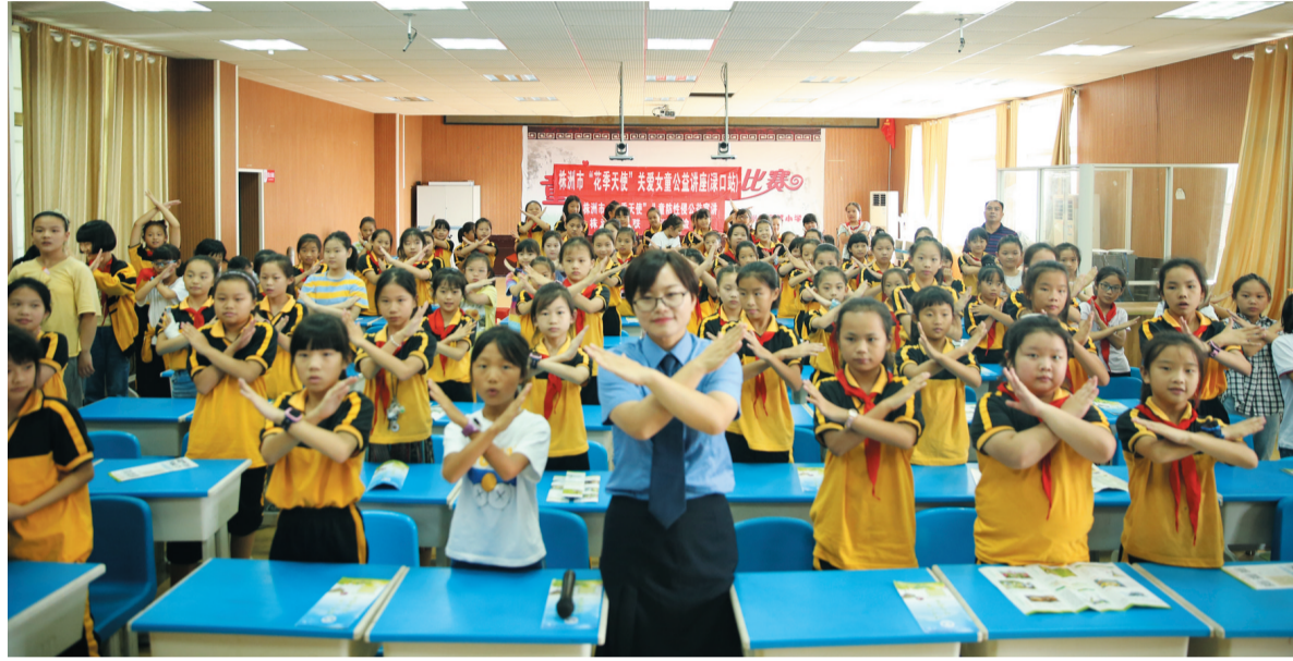
▲检察官走进校园开展“花季天使”公益宣讲。