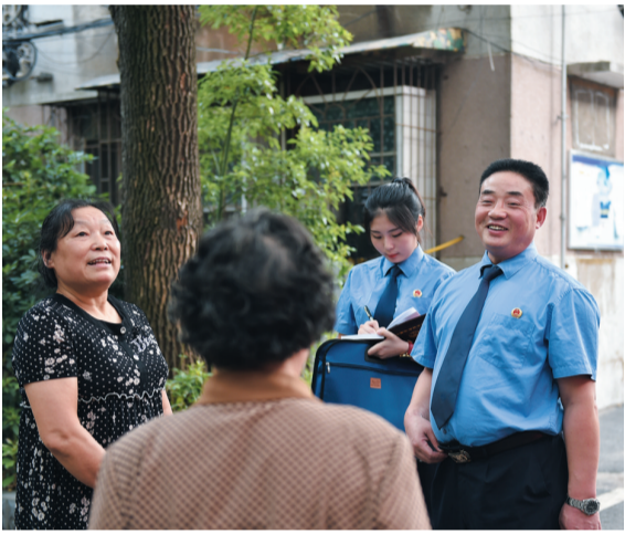
▲检察官走访社区居民进行普法宣讲。

新时代呼唤新担当,新使命激发新作为。2016年以来,株洲市人民检察院在习近平新时代中国特色社会主义思想指引下,认真贯彻中央、省、市委的相关部署,紧密结合检察工作特点,争当普法先锋,深入落实“谁执法谁普法”责任制,做好规定动作,创新自选动作,在执法普法力度、广度、温度、角度上持续发力,为法治株洲建设、服务经济社会发展贡献了检察力量。