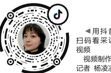
用抖音扫码来看访视频 视频制作:记者 杨凌凌

记者问,如果有一天,他跑不动了、干不了了,修鞋屋就此关张了怎么办?老陈笑着说:“再说吧,没想过那么远的事呢。现在就是活在当下,一边快乐修鞋,一边寻找徒弟。”就在记者结束采访时,一名女子提了鞋子从河西特意赶来修。老陈接过鞋子看了看,神情严肃,转而点点头,嘱咐她取鞋的时间。女子没有马上离开,而是看着老陈干了好一阵子的活。她默默念叨着:“这也是一种工匠精神啊……”(记者 杨凌凌)(请王先生来报社领取40元线索费)