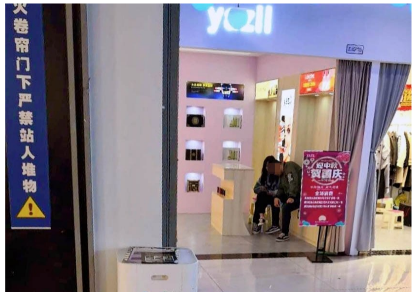
▲通过暗中观察,民警发现这家化妆品店其实大有文章 通讯员供图

闹市中的美妆店,每天都有妙龄女子进进出出,经常买完东西出来又默默还回店里。近日,建设派出所民警在巡逻时发现这一不寻常的现象,经过深入调查,一个诈骗团伙浮出水面。10月13日凌晨,13名团伙成员悉数落网。