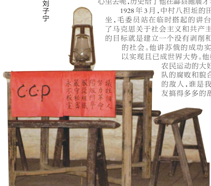
叶家祠内展示的“ccp”标示和入党誓词