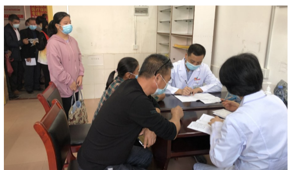
▲中心医院专家在为村民义诊

本报讯(记者 郑炜青)昨日上午,市中心医院20名专家教授坐堂茶陵县严塘镇中心卫生院义诊,前来求医问诊的村民络绎不绝。