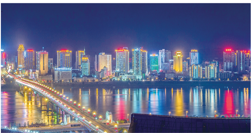
株洲夜景

媒体融合,移动优先。欢迎来到“火龙果视频”专区。在这里,我们用视频推介株洲高质量发展亮点,扫描当下时政社会热点,服务市民生活难点。我们期待,所有读者,一同参与,或提供成品,或共同拍摄制作。题材不限,有趣的、有用的、工作的、生活的,均可。联系电话:22896942;视频投稿邮箱:736700050@qq.com(可发视频,也可只附上网上链接地址),一经采用,稿酬从优。