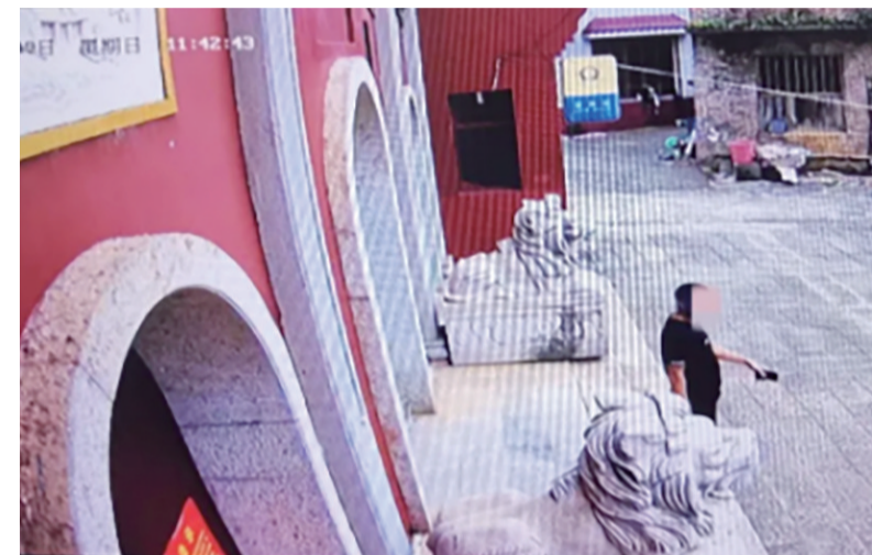
▲嫌疑人在攸县阳升观实施盗窃

本报讯(记者 李卉 通讯员 刘然)攸县公安局于近日破获跨省盗窃功德箱系列案件,打掉一个流窜湖南、湖北、河南、河北、广东、广西、四川、甘肃等多地的专盗寺庙、道观功德箱财物的犯罪团伙。