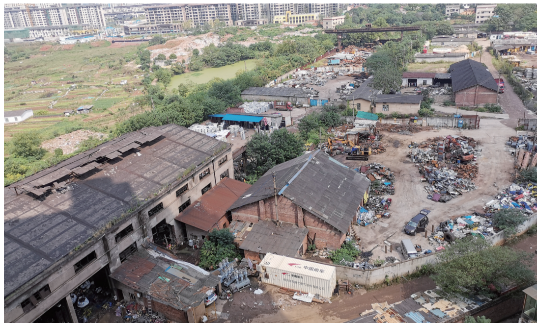
▲几家废品收购站俯瞰图