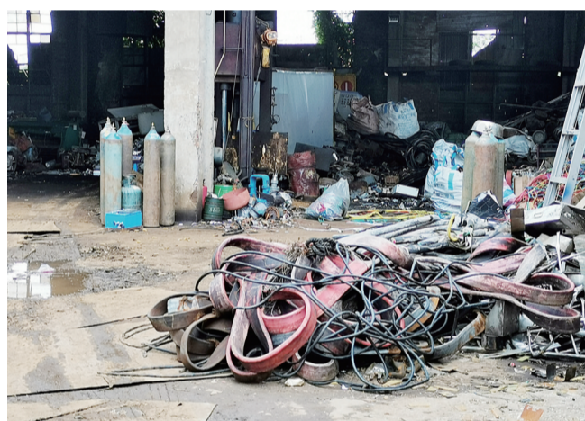
▲废品收购站门口及店内堆积着废品

10月9日中午,记者来到新桂广场小区看到,废品收购站与该小区仅一墙之隔,在该片区,有五六家废品收购站,里面有很多废电机、废钢铁等,也有一些液化气罐。