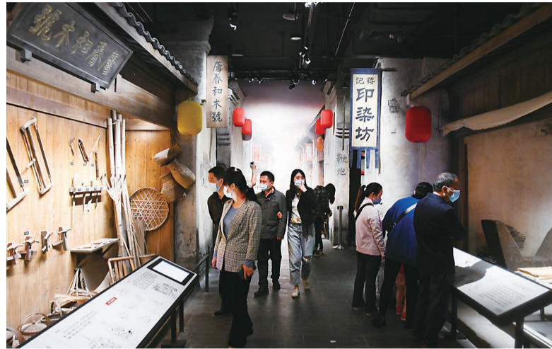
▲假期来市博物馆参观的市民络绎不绝

本报讯(记者 黄欣雨 通讯员 李茂春)10月9日,记者从市文旅广体局了解到,2020年“十一”期间,株洲市接待游客总人数达433.56万人次,旅游总收入25.9亿元。