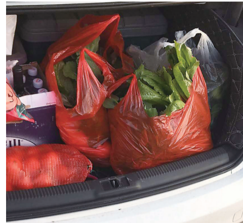
▲杨先生的后备厢

本报讯(记者 杨凌凌)昨日是节后上班第一天,市民杨先生在朋友圈分享了自己开车从老家回来后后备厢的照片,后备厢塞满了各种菜,杨先生笑称自己回趟老家仿佛成了进货商。有不少网友评论:泪流满面,这里头不仅有家乡的味道,更多的是家人满满的爱。