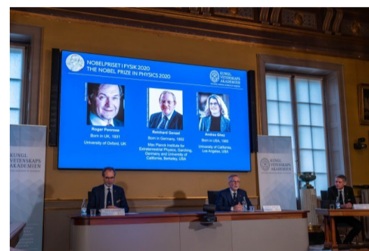
10月6日,在瑞典斯德哥尔摩,瑞典皇家科学院公布2020年诺贝尔物理学奖获得者

今年的诺贝尔物理学奖颁给了三位获奖者,罗杰·彭罗斯、赖因哈德·根策尔和安德烈娅·盖兹。因为他们发现了宇宙中最奇异的现象之一——“黑洞”。