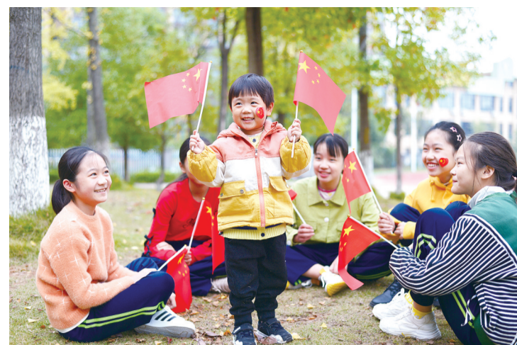
小区绿地,一个孩子跟小姐姐们一起快乐玩耍。