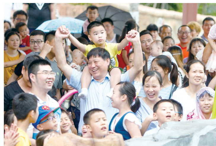
假期里,外出游玩的市民也很多。