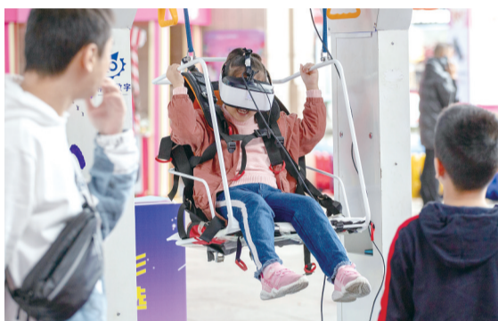
国庆假期,孩子们体验VR虚拟技术。