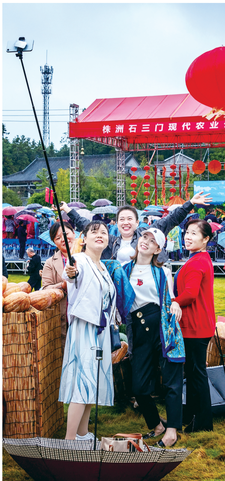
金秋十月收获季,农家丰收节吸引了市民。