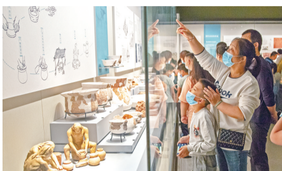
市博物馆乔迁新址,来了不少市民参观。