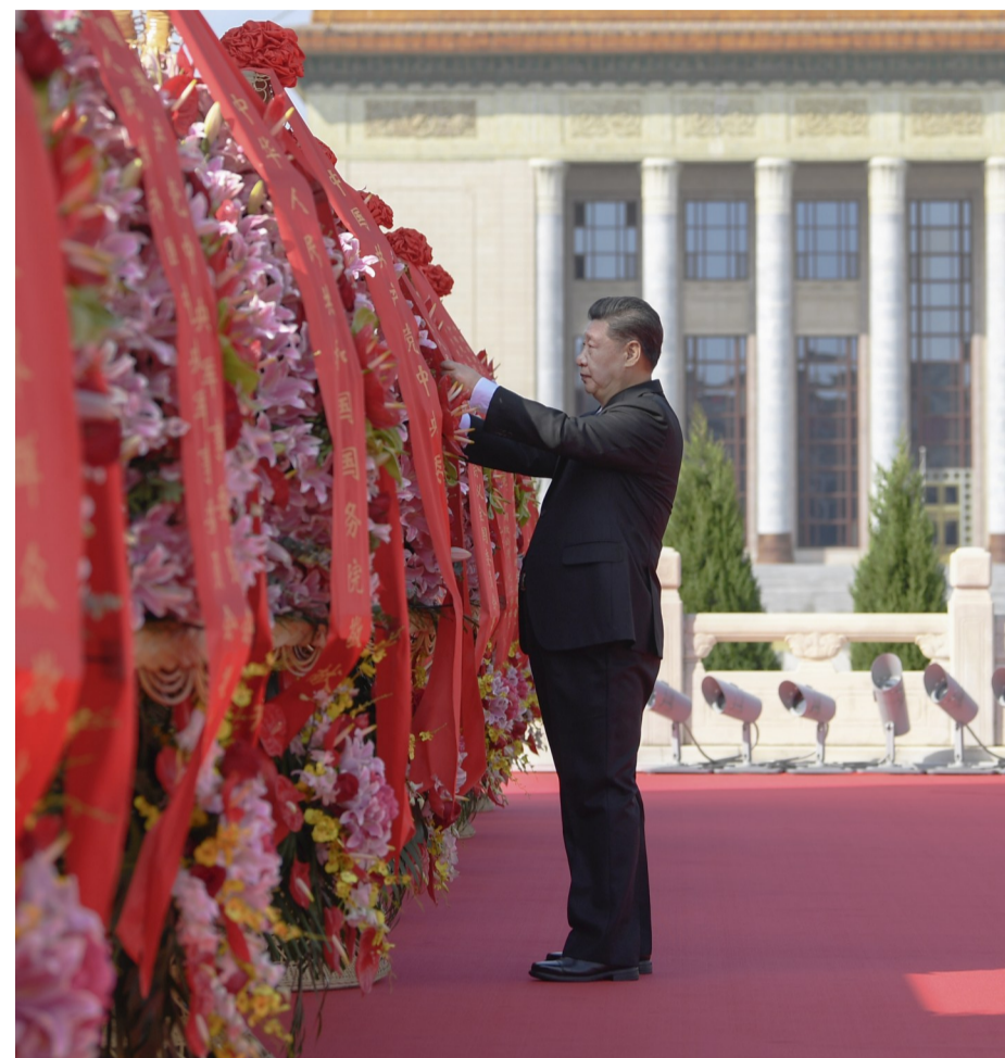
▲9月30日上午,党和国家领导人习近平、李克强、栗战书、汪洋、王沪宁、赵乐际、韩正、王岐山等来到北京天安门广场,出席烈士纪念日向人民英雄敬献花篮仪式。这是习近平整理花篮上的缎带

烈士纪念日向人民英雄敬献花篮仪式在京隆重举行 习近平李克强栗战书汪洋王沪宁赵乐际韩正王岐山出席