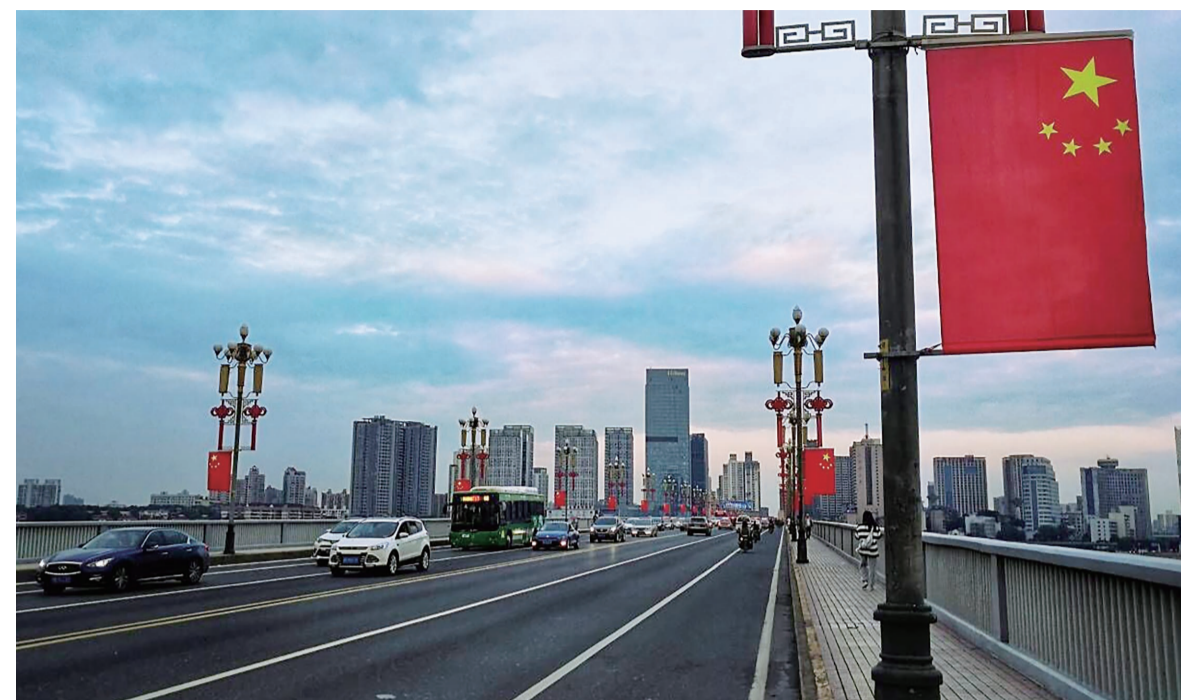
▲9月30日下午,株洲大桥,久违的云霞迎接中秋国庆的到来