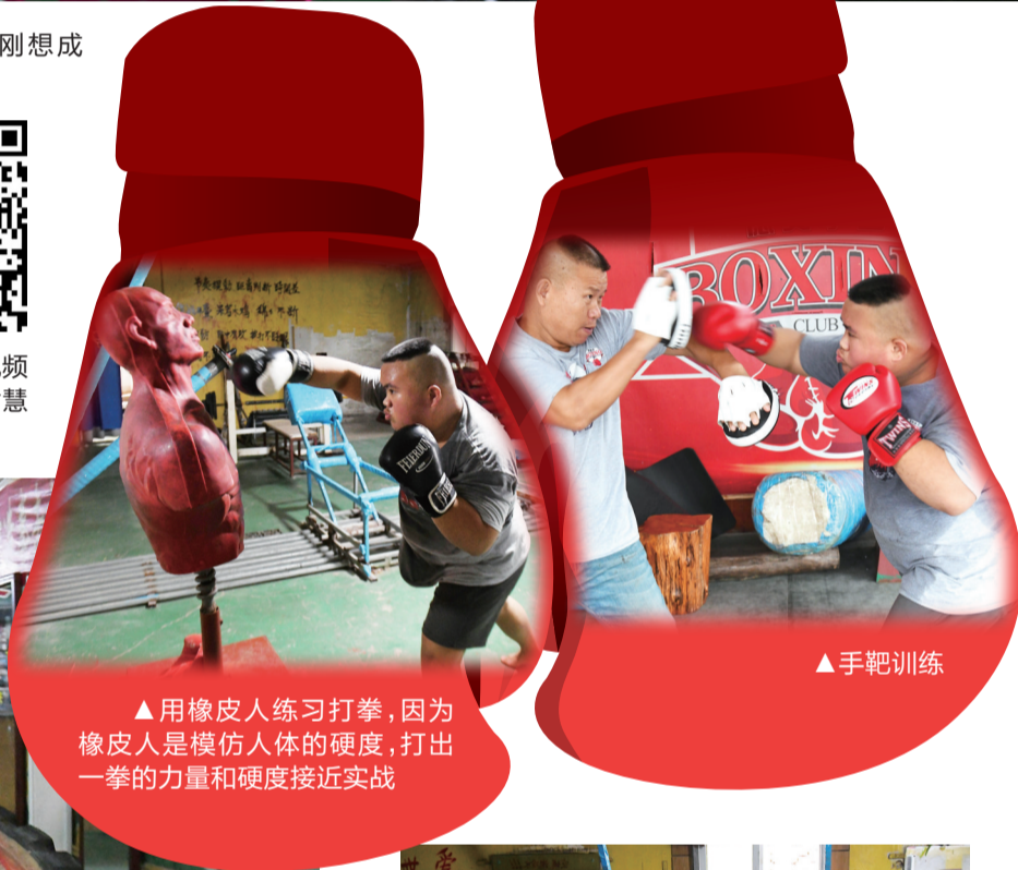
▲ 用橡皮人练习打拳,因为橡皮人是模仿人体的硬度,打出一拳的力量和硬度接近实战