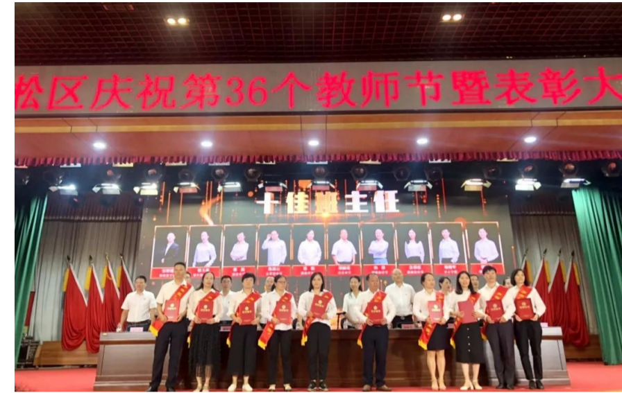
▲颁奖现场

本报讯 9月24日,记者从市外国语学校获悉,该校10名教师荣获2020年芦淞区教师评优评先奖项。与此同时,该校“基于STEAM教育理念和‘PBL’教学模式的STEAM课程开发与实践研究”项目获得2019年度教育改革创新项目二等奖。