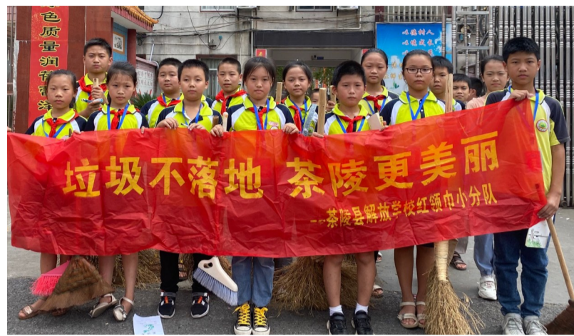
▲茶陵县解放学校学子走上街头清理垃圾

近日，“一张宣传单、一次大宣讲、一次亲子活动、一次实践活动、一次评比活动”在茶陵县掀起了一波人居环境整治的新高潮。为迎接国庆、中秋双节的到来，落实好城区市容市貌专项整治“百日攻坚”行动与农村人居环境整治工作，茶陵县教育局在全县中小学、幼儿园的学生中开展了“小手拉大手，文明一起走”活动。活动的形式多样，内容丰富，给人居环境整治带来了新的活力，新的成效。