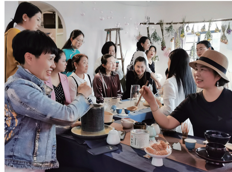
▲市茶艺协会组织交流活动

华灯初上,茶汤见淡。正要道别,她又从柜中取出一包茶:“急什么,再好品品这个正山小种,我来泡……”