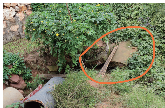
▲天元区楚天花园小区后门,督察组发现一处流量大的不明水流