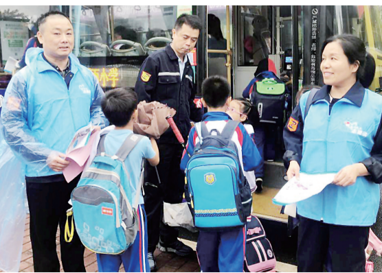
▲公交志愿服务队向学生发放绿色出行倡议书