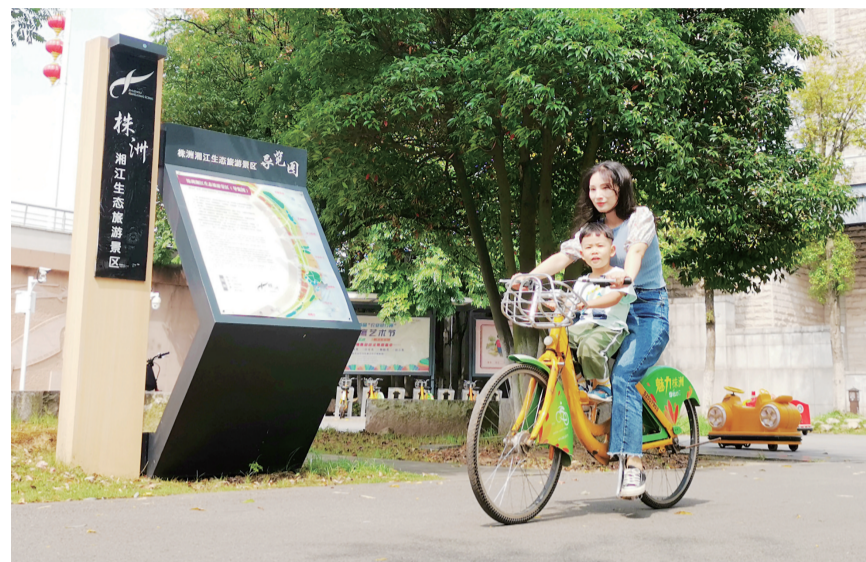
▲市民在湘江风光带骑行公共自行车

本月是“绿色出行宣传月”。昨日,记者通过株洲公交健宁公司的部分大数据,梳理了株洲人的“绿色生活”。