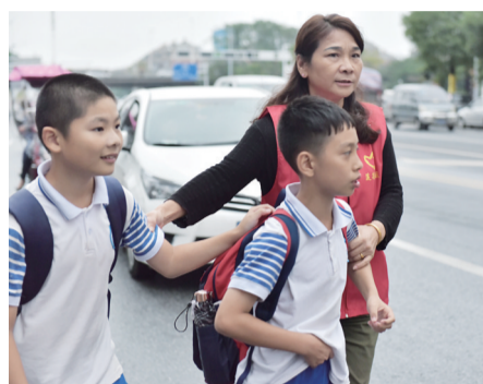
▲志愿者护送孩子们过马路

本报讯(见习记者 黄欣雨 通讯员 罗雄武)“小朋友,不要在马路上追逐打闹”“注意看车,跟着阿姨走”……9月21日下午5时许,天元区旺城·天悦小区的马路边,由红莲互助会志愿者组成的护学队,正在护送孩子们安全通过马路。他们身着“红马甲”,实时观察周围交通状况,并提醒孩子注意安全。