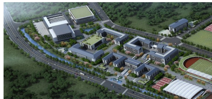
▲玉溪职教园区(一期、二期)效果图

近日,株洲市装配式建筑产业链办公室成员前往浙江、上海考察装配式建筑产业链上企业,通过与链上企业的交流与合作,以推动我市装配式建筑产业链强链、补链。