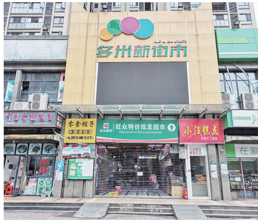
▲多米新街市中建御山和苑店大门被关