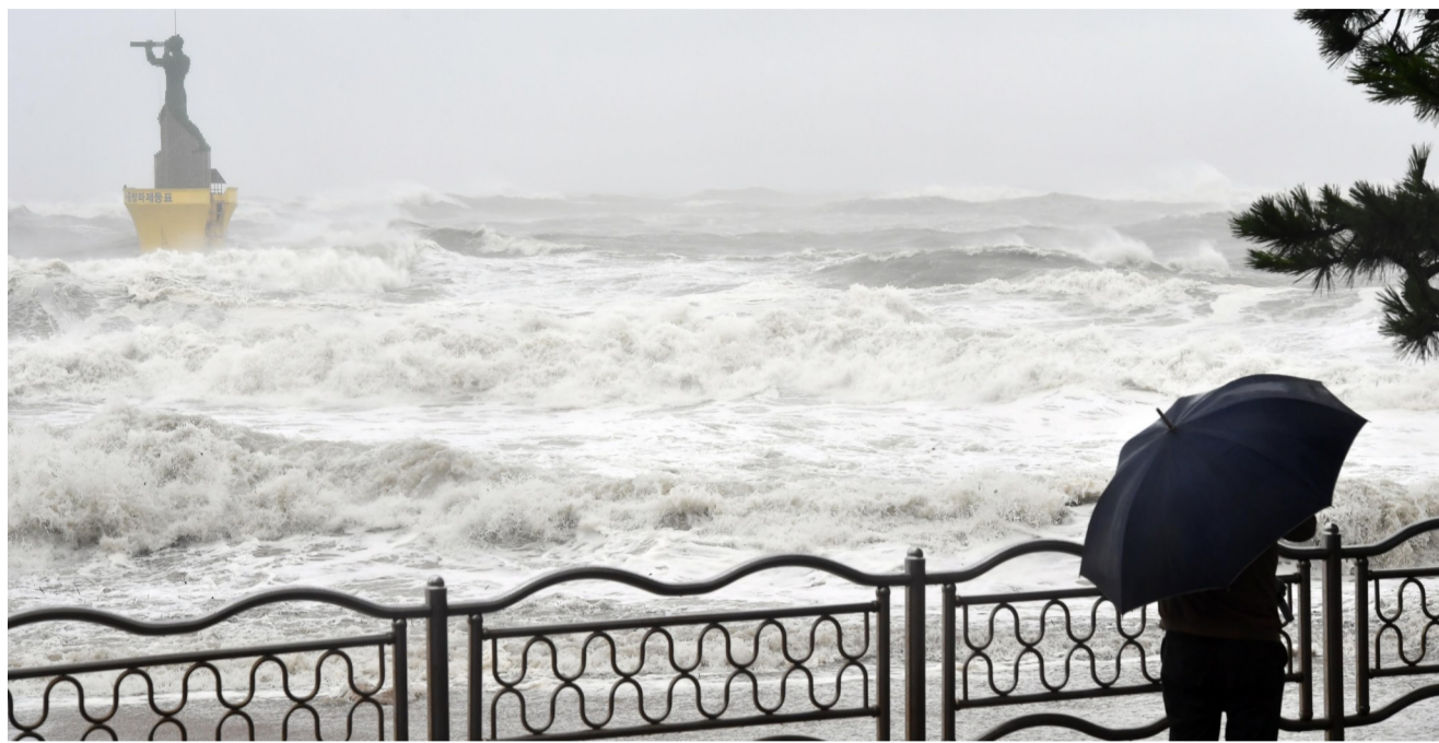
▲今年第10号台风“海神”9月7日掠过韩国,造成2人失踪(资料图)

9月21日,为做好台风命名工作,积极推广普及防灾减灾知识,提升公众对台风的认知和预防能力,中央气象台开展“我给台风起名字”活动,邀请公众来给台风取名字。最终选定的台风名将于2021年2月召开的会议上公布。中央气象台将给最终选定名字的公众颁发台风命名专属证书。