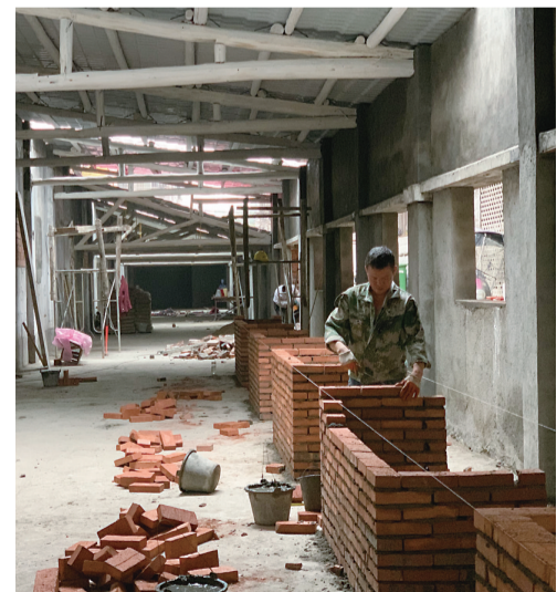
▲正在建设中的井勘社区便民服务站