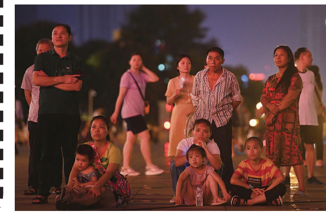
▲精彩的电影故事引人入胜