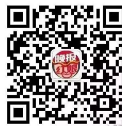
▲扫码添加株洲晚报红娘官方微信公众号

“株洲晚报红娘”是株洲晚报全媒体公益交友平台,通过线上线下联动,为我市优质单身青年提供联谊交友机会。所有线上、线下活动均会通过株洲晚报或者“株洲晚报红娘”微信公众号发布,不会私人添加微信收费。请大家提高警惕,注意甄别,谨防上当受骗,同时,本报已向警方报案。