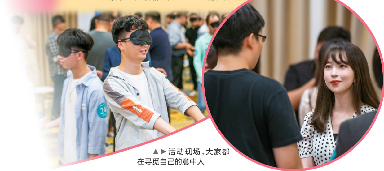
▲活动现场,大家都在寻觅自己的意中人