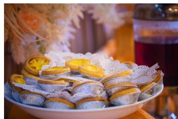
▲活动现场处处有惊喜