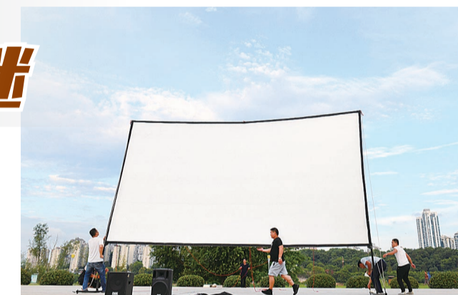
▲每一场电影的放映都离不开工作人员的辛勤付出

从今年7月至12月底,我市计划在钢琴广场、神农城广场、体育中心、文化园、天鹅湖公园等城市固定放映点放映500场公益电影,为市民奉上丰富多彩的电影文化大餐。(见习记者 黄欣雨/文)