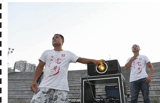
▲工作人员在调焦距