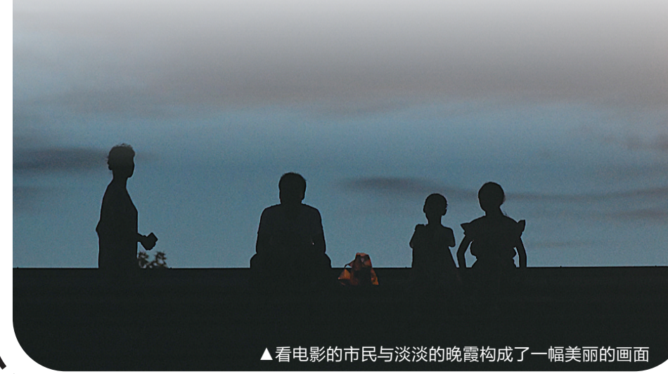
▲看电影的市民与淡淡的晚霞构成了一幅美丽的画面