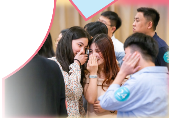
▲活动现场气氛融洽