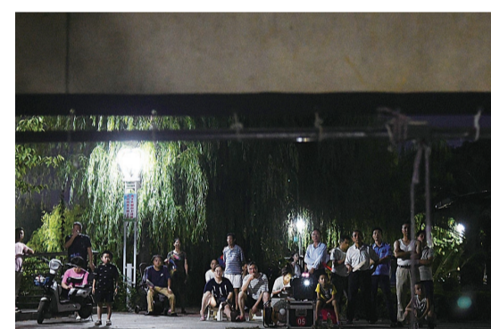
▲很多人对露天电影仍然带着乡愁般的怀念

傍晚时分,西边还留有几丝晚霞的余晖。在神农城广场,株洲公益电影的放映员们忙碌起来,摆好电影放映机,架好幕布支架,为电影的放映准备着。幕布升起,宛如一面旗帜,不多时便吸引来众多电影爱好者驻足。大家三五成群,席地而坐,告别一天的忙碌,静静等待着电影放映的开始。老远望去,一张张期冀的脸上,闪烁着明亮的光。