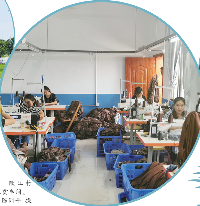
欧江村扶贫车间。