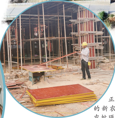
正在施工的新农·湘赣农批项目。陈洲平 摄

“以人民为中心。”一句话道出了洙江街道建设全面小康的初心,也是干在实处、走在前列、勇立潮头的不懈动力。