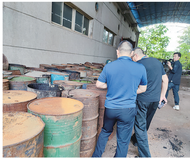
▲督察组一行在海利株洲公司仓库查看残渣废液

省第一生态环境保护督察组于9月15日至9月29日对株洲市开展生态环境保护督察“回头看”。期间,督察组公开受理有关生态环境保护及生态文明建设方面的来信来电举报,并接受群众对督察工作的监督。举报电话:0731—22832258(8:00—18:00);邮政信箱:湖南省株洲市A209信箱。