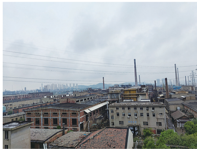
▲依托株化、株冶、智成化工老厂,株洲将建工业遗址公园