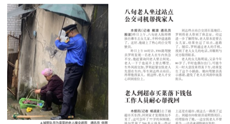
八旬老人过马路路口,城管队员暖心搀扶,工作人员耐心帮其找包,老人感动落泪。

网友“相逢何必曾相识”:没有比较就没有伤害!本地城管比起前段时间上热搜的国内某市城管的野蛮执法温馨多了。