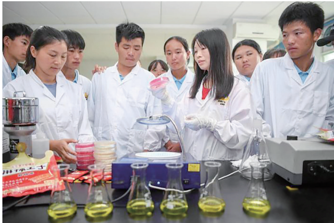
▲老师手持培养皿教学生观察辣条菌落

“网红食品各类培训班的开设,其实也是在进一步地规范化和专业化,所以,我对这一类的培训班是非常赞同的。”朱丹蓬说。