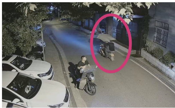
▲摩托车后排男子低着头、弯着腰一闪而过，结果引起了警方的注意