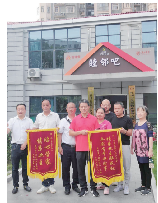
▲昨日,香博堡小区的居民代表制作锦旗送到社区居委会和物业公司,表示感谢

业委会成员、党员代表、楼栋长、网格员等议事会成员进行充分协商、讨论,之后启动招投标程序,引入新物业公司,带资进场并修好8栋的两台电梯,成为新公司进驻小区的前提条件。从8月至今,新物业公司联系专业队伍,多方采购零件,已于近日将两台电梯修缮一新,解决了困扰居民多年的心病。