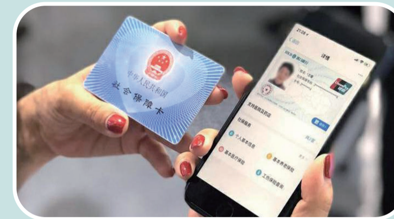
▲武汉市民把社保卡“放进”支付宝里(资料图)

业务,使用医保就诊、购药等,都离不开社会保障卡。可是,随身携带这样一张卡片,不仅不方便,还有遗失的风险。2018年4月,人力资源和社会保障部签发了第一张全国统一的电子社保卡,从此,社保卡可以“装”进手机里,省去了携带实体卡的麻烦。电子社保卡问世两年多来,应用情况如何?