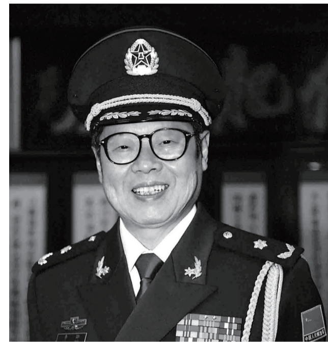
▲李铎, 1930年4月19日生于醴陵原新阳乡青泥村, 中国著名书法家、文职将军

李铎著有《书法入门》, 出版有《李铎书前后出师表》《李铎画集》《李铎书<孙子兵法>碑拓全集》《李铎书<李铎和他的艺术>》《李铎书千字文》《我爱我的祖国-李铎诗词书法集》《李铎书画集》《李铎论书断语》等字帖和专著。