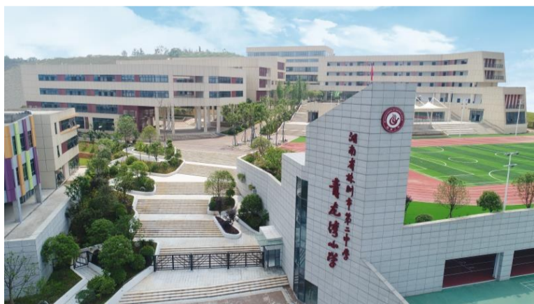
▲株洲市二中青龙湾小学实景图

株洲市二中青龙湾小学9月1日已开学,2021年二中青龙湾小学预计开设一年级8个班、二年级8个班、三至六年级预计各2个班;市二中青龙湾中学借助小学场地先行办学,2021年预计初一开设4个班,初二初三预计各开设2个班,2021年二中青龙湾小学中学双校预计招生计划1280个。蓝谷国际与二中青龙湾小学一田之隔,与二中青龙湾中学一路之隔,业主子女均可优先入读,在家门口享市二中全龄教育资源,让孩子赢在起跑线!