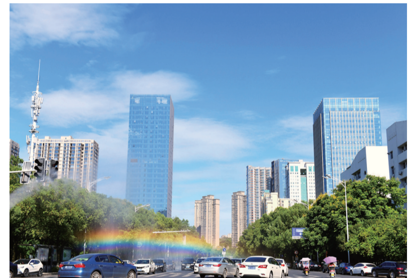
▲8月,城区空气质量达标率同比上升9.7%

本报讯(记者 杨凌凌 通讯员 崔林)9月16日,株洲市生态环境局公布了8月全市大气质量状况。今年8月,株洲市城区共有27个优良天。空气质量达标率为87.1%,与上年同期(77.4%)相比上升9.7%(增加3天),空气中首要污染物为臭氧。