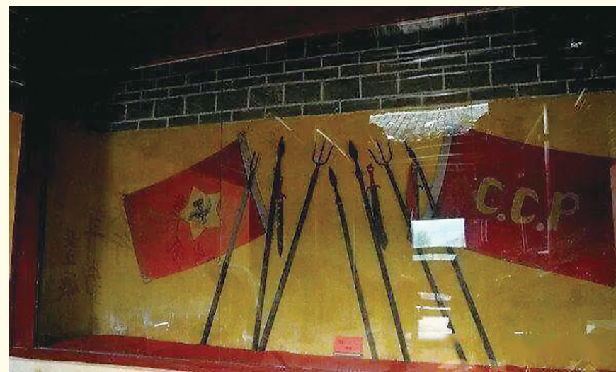
▲攸县苏维埃政府兵工厂,用“攸饼铁”打造的大刀、梭镖、三角叉等兵器(资料图)

“攸饼铁”是攸县的历史名牌产品,从清光绪年间至民国时期远近闻名,在县内外乃至省内外都有较大较好的市场。“攸饼铁”又是怎样炼出来的呢?