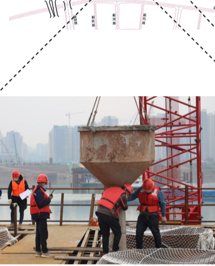
▲清水塘大桥施工现场