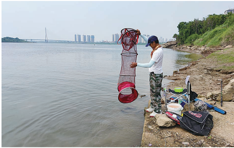
▲9月3日,在四水厂一级饮用水水源地保护区内垂钓的男子被制止