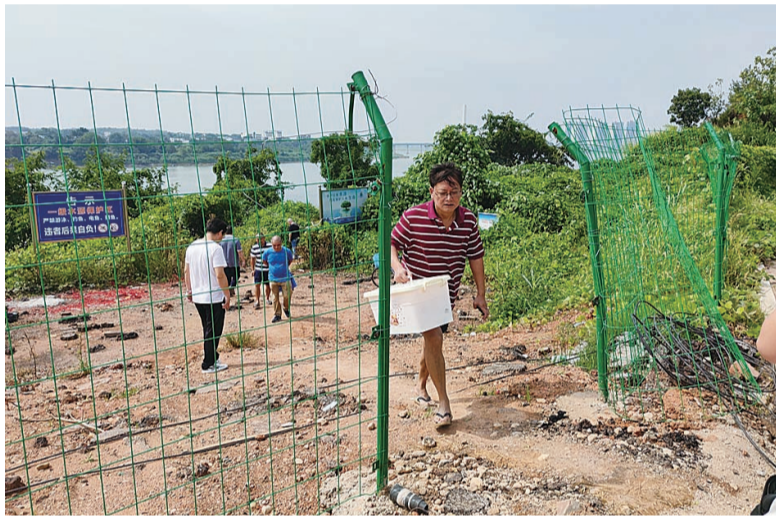
▲四水厂一级饮用水水源地保护区的隔离围栏被破坏

本报讯(记者 杨凌凌)湘江是株洲城区唯一的饮用水水源地。针对市民反映湘江河西株洲四水厂饮用水水源一级保护区内,时常存在