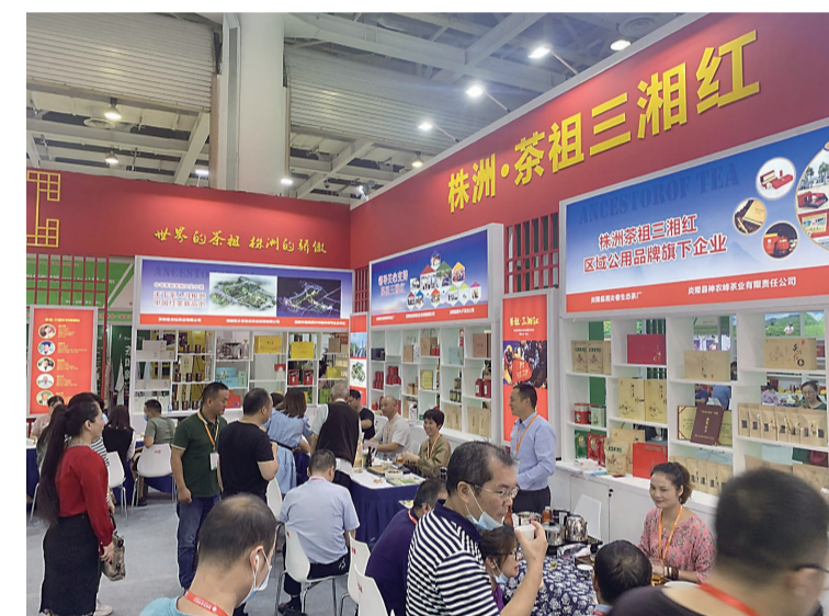
▲本次茶博会株洲展台吸引了众多观展者前来品尝

本报讯(记者 贺天鸿 通讯员 尹照)9月12日,第十二届湖南茶业博览会暨株洲·茶祖三湘红公用品牌推介会在长沙举行,多款株洲茶在会上亮相。