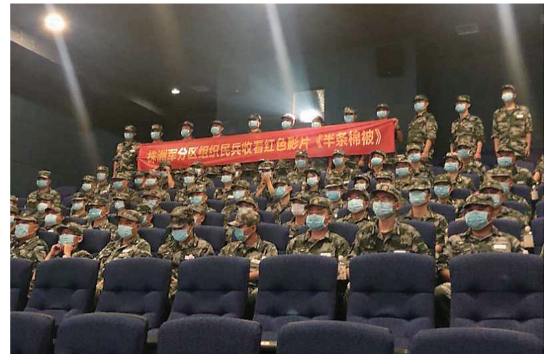
▲观影后,官兵集体合影

近期,电影《半条棉被》在株洲各大影院公映。9月10日,株洲军分区组织官兵和轮训的基干民兵在双拥共建单位——株洲美达国际影城进行观看,再次感受战争年代血