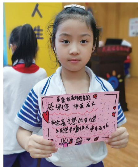
▲栗雨小学校园记者亲手制作的教师节贺卡