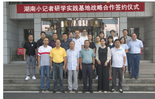
▲湖南小记者研学实践基地战略合作签约仪式在酒仙湖景区举行,图为与会嘉宾合影