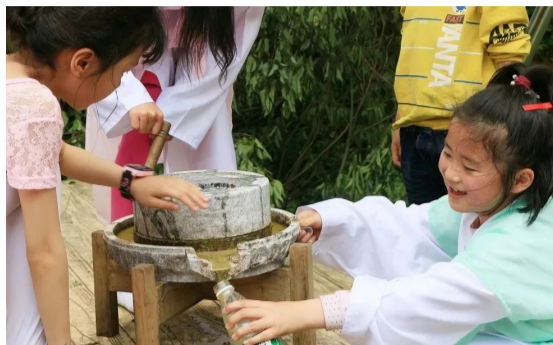
▲酒仙湖非遗文化体验馆,学生手工磨豆腐