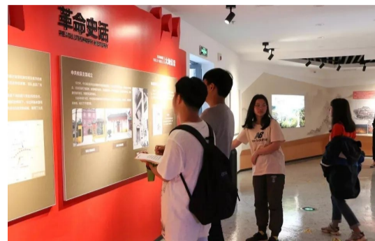
▲学生参观红色纪念馆