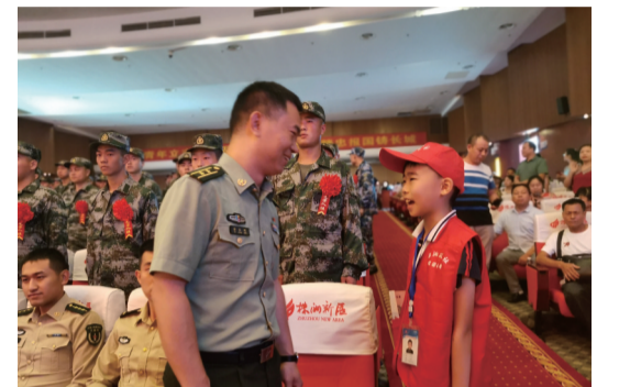
▲校园记者采访准新兵

“哥哥,你好,我是来自天元小学的小记者,您为什么会选择参军呢?”“马上就要开启军营生活了,您此时此刻心情是怎样的呢?”“对于未来的军营生活您有什么期待呢?”一年一度的新兵入伍开始了,9月9日上午10点,天元区2020年新兵入伍批准仪式暨欢送大会在天元区会议中心三楼会议厅举行,天元小学的小记者们也来到了活动现场,对本次的入伍新兵们进行了面对面的采访,提出了一个又一个有趣的问题。