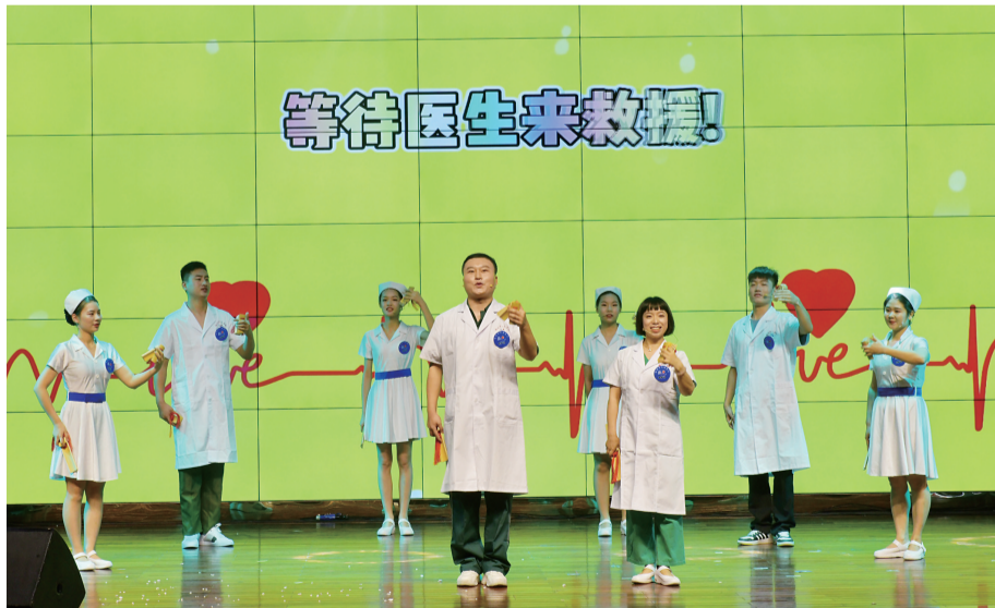
▲医护人员“说学逗唱”,将枯燥的医学问题演绎得通俗易懂又幽默风趣

本报讯(记者 杨凌凌 通讯员 李晓兵 宋玺)9月11日,株洲市健康科普宣讲大赛在市中心医院举行。平时身穿白大褂的医护人员脑洞大开,借助情景喜剧、小品、动画短片等表演形式,用通俗易懂、幽默风趣的话语,为观众带来了一场医学科普大餐。