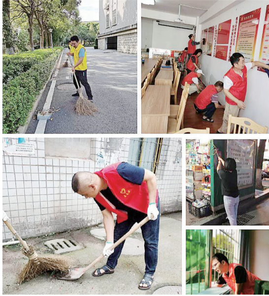
市民纷纷进行“铲癣清道”美颜行动。(通讯员供图)

网友“石头妹”: 由于市政修路路面抬高,导致井盖下沉。为了方便市民出行,株洲移动志愿者迅速行动,及时调整井盖高度,为株洲创文贡献自己的一份力量。