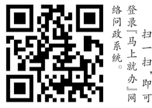
扫一扫,即可访问政系统。

天元区政府回复: 力嘉路道路两侧已经出让,因建设方需要升级道路规划,故进行封闭施工。目前正在抓紧完善土地手续,待项目建设完工后,力嘉路也会同期升级改造完成。