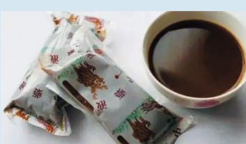
▲越来越多的肥胖人群选择中药来减肥瘦身。