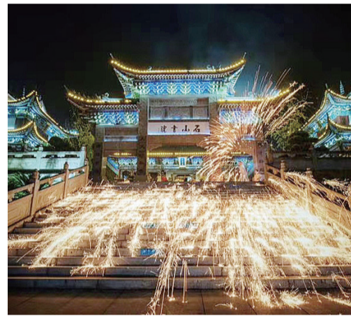
攸县打铁水。

本次拍摄内容共有4个版块,分别是口述篇、实践篇、教学篇和综述篇。目前,摄制组已完成口述篇和实践篇的拍摄,下一步,摄制组将深入传承人家中,进行全方位取景拍摄,多视角、深层次对“攸县打铁水”的历史、文化、旅游等有代表性的元素进行深入挖掘和解读。