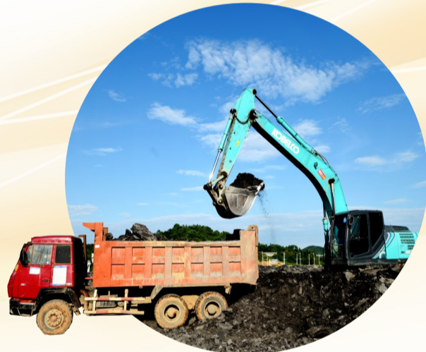
三一智能制造以及金属材料数字化加工贸易中心施工现场。