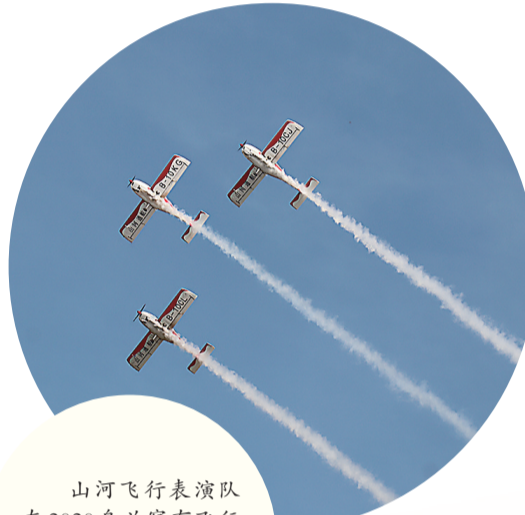
山河飞行表演队在2020乌兰察布飞行大会上的表演

这种模式,迅速在全市17个新兴优势产业链中全部铺开,发挥出联动的综合效应。仅上半年,17条产业链上累计签约项目98个,BVV车轴、新能源智能多功能装备研发基地、捷宇实业等一批强链延链补链项目纷纷落户,轨道交通、新能源汽车、绿色食品、高分子材料、服饰、人工智能与大数据等多个产业链收获满满。