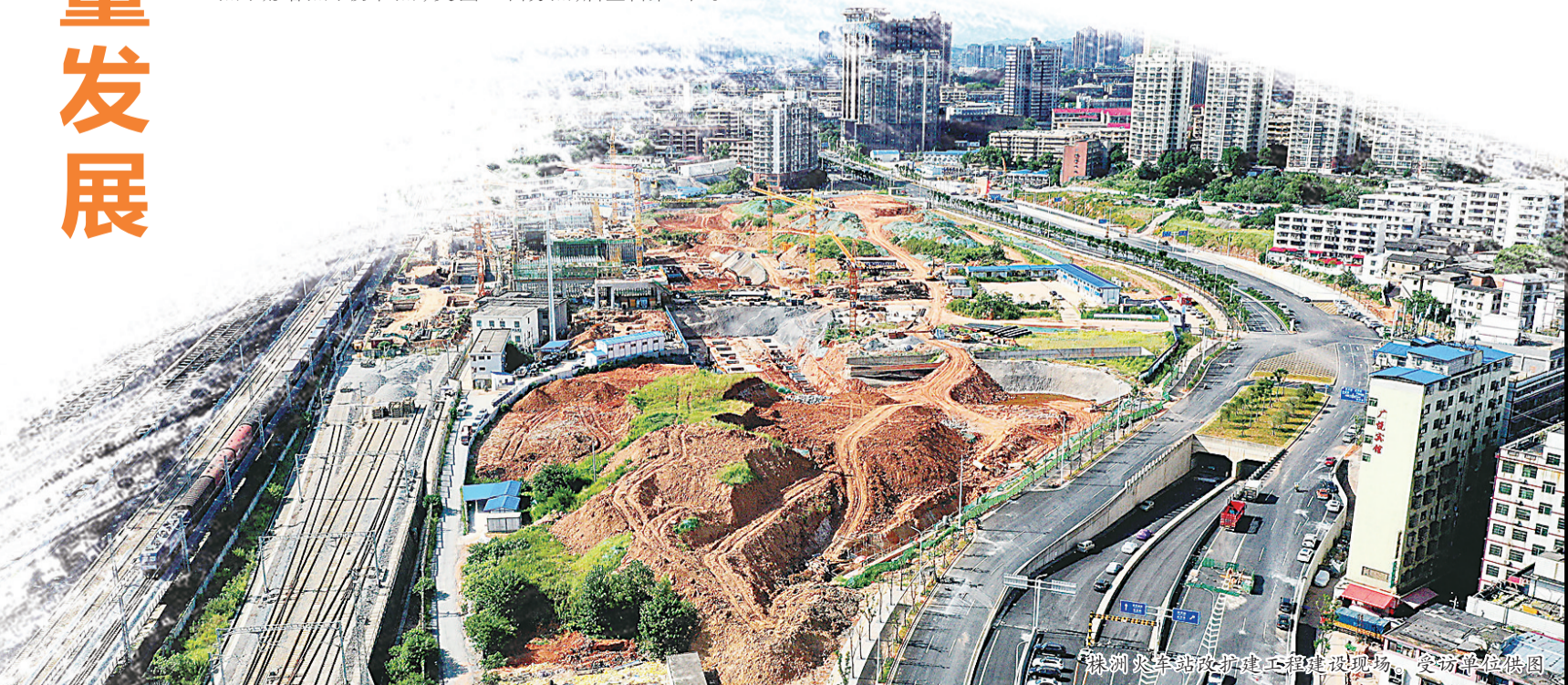
株洲炎帝陵改扩建工程建设项目。

一个个创新驱动的“强磁场”在株洲聚合,上半年,全市高新技术产业实现总产值1016.3亿元,增长8.4%;实现高新技术产业增加值317.2亿元,增长8.2%,增幅排名全省第一。