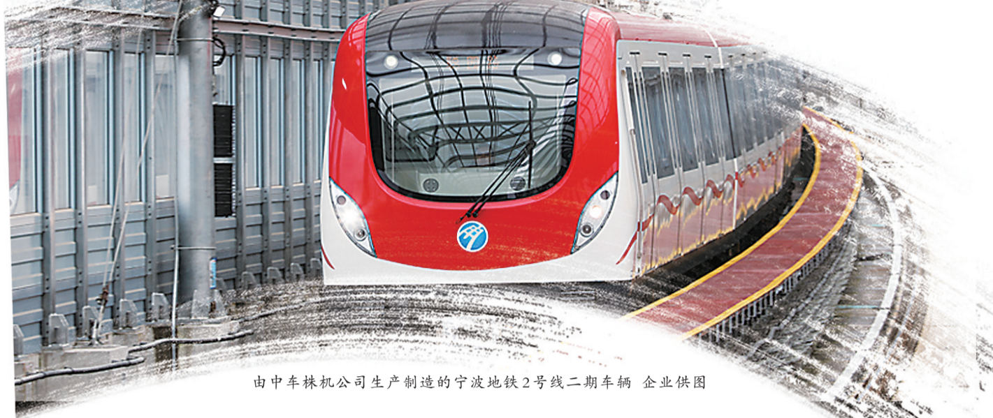
由中车株机公司生产制造的宁波地铁2号线二期车辆