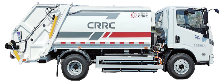
中车电动新推出的新能源环卫车型

今年以来,中国动力谷“3+5+2”的产业体系展示出强劲的脉动,以更快的创新频率、更大的集群配套、更活的增长环境,彰显着逆行风船、走上坡路的发展活力。