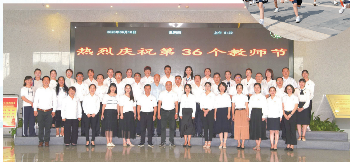
全体受表彰先进个人与区领导合影留念

一片丹心办教育，桃李芬芳香满园。如今，在株洲经开区、云龙示范区，广大教育者只争朝夕，真抓实干，形成了以重教为本、以兴教为先、以支教为荣的良好教育氛围，向着“教育名区”的目标奋勇前进，一幅让群众满意、人人喝彩的云龙教育华美画卷正徐徐展开。