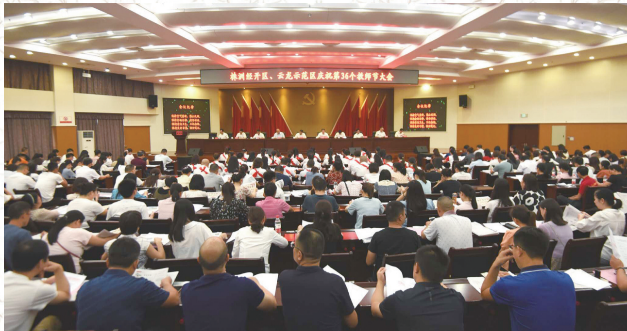
云龙示范区教师表彰大会现场

近年来，株洲经开区、云龙示范区优质教育资源不断聚集，老旧校区全面提质改造升级，硬件、软件同步大幅提升，迅速跻身全市品质教育第一方阵，成为株洲城市发展中熠熠生辉的新名片。