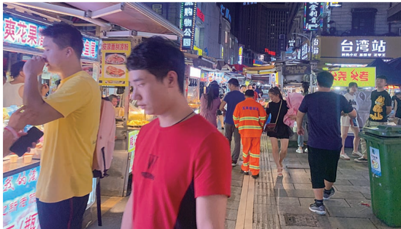
▲钟鼓岭步行街,环卫工人正忙着清扫保洁