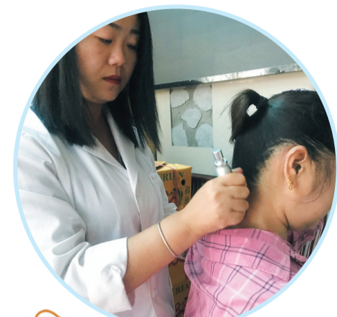
苗公善水工作人员耐心地给颈椎不适的读者进行按摩