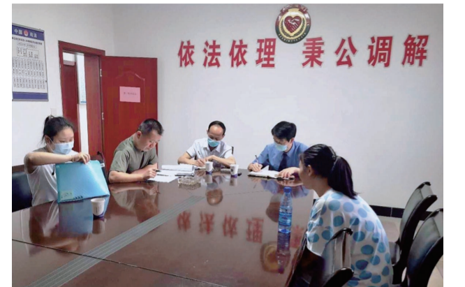
▲人民调解员正在组织调解

此外,还有一些调委会无牌子、无场地、无调解庭,距离阵地规范化、标准化还有一定的差距。